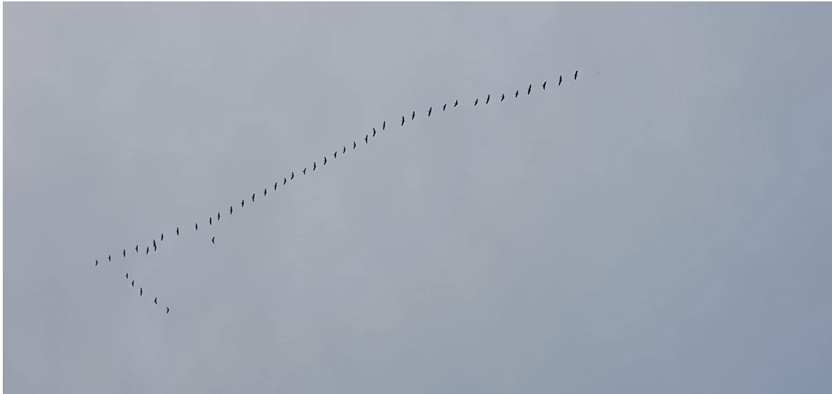
Imagen nº: Grullas por Toledo, Foto: María José Santero