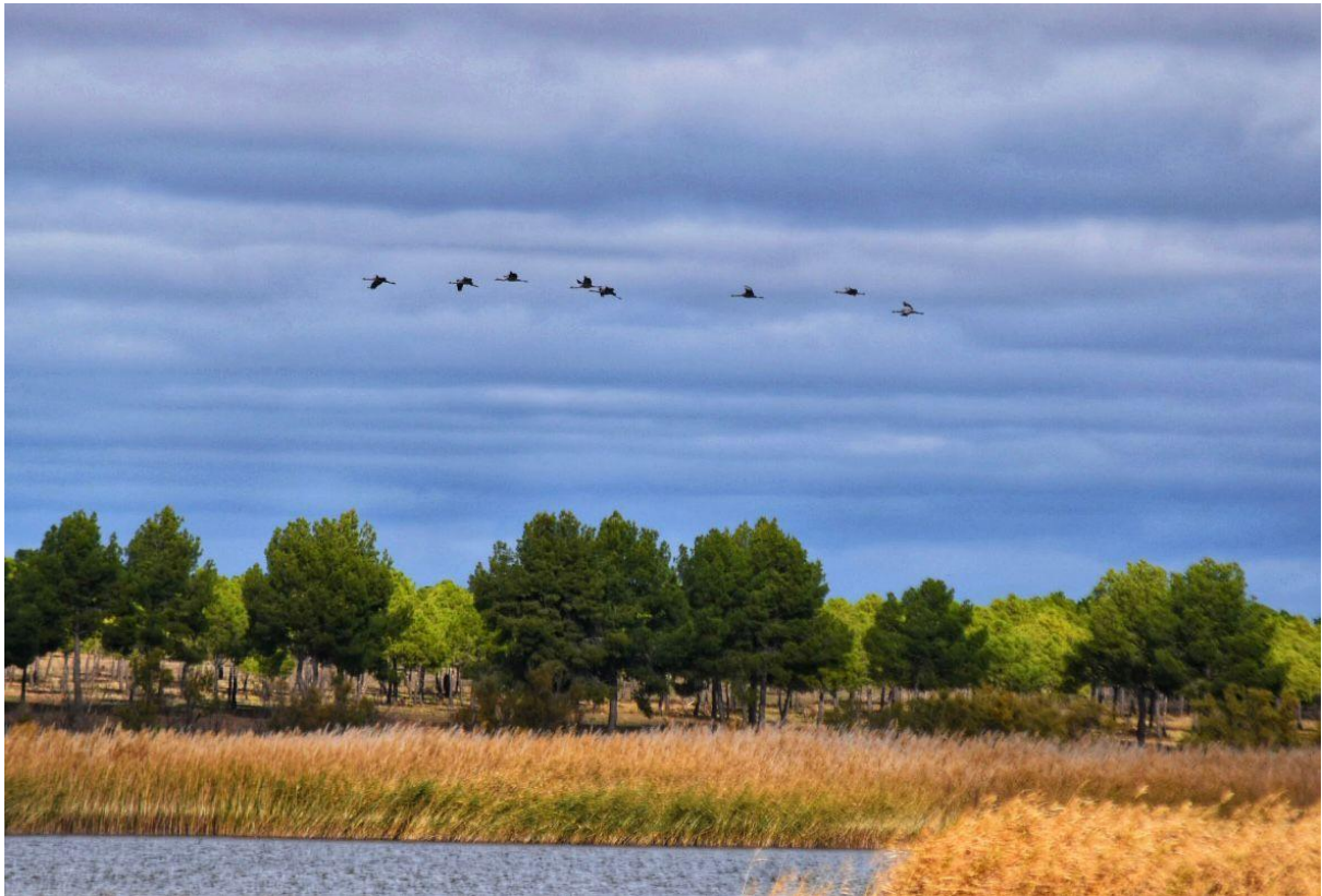
Imagen nº: Grullas sobre lagunas de Villafranca de los Caballeros (TO).

Real (BA); 23 por Puente Ajuda (BA) Joaquín Mazón; 23 en lag a de Hito (CU) Gumer González; 232 por Villar del Olmo (M) Juan C. del Moral.