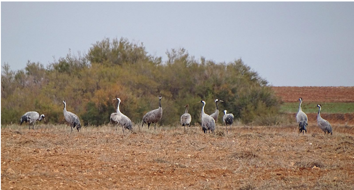
Imagen nº: Grullas en lag a Dulce de Campillos (MA).