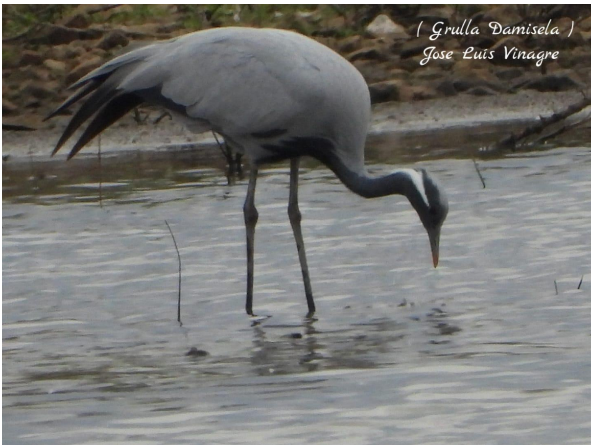
Image nº: Grulla damisela en emb de Morantes. Foto: José L. Vinagre.

1 Grulla damisela ( Anthropoides virgo ) en emb de Morantes (BA), probablemente un escape de cautividad, José L. Vinagre.