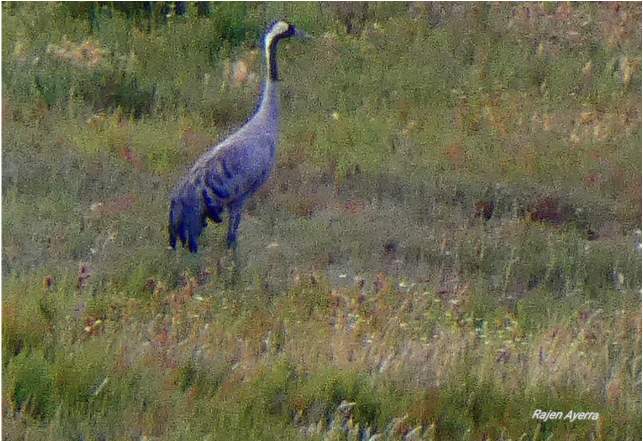
Imagen nº 2: Grulla solitaria en laguna de Pitillas (NA).