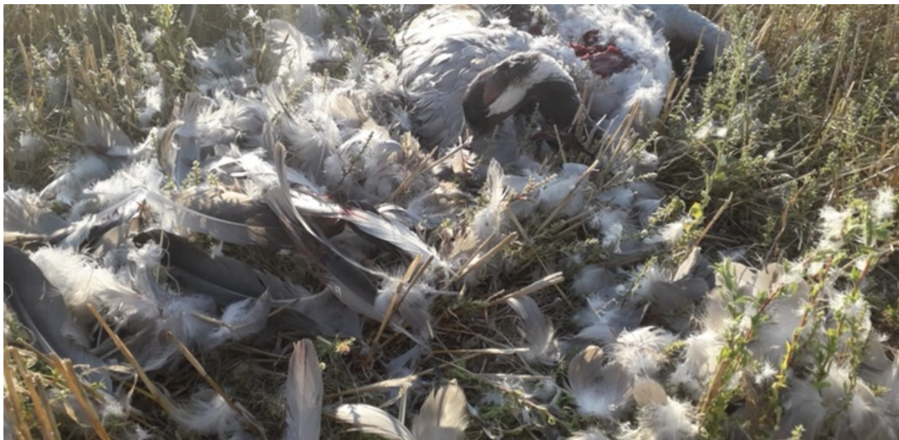
Imagen nº 5: Grulla depredada por Águilas reales.

31/08/20: 1 en Emb de la Loteta (Z) Javier Train; 8 llegan al lag Der (FR) Carlos Sour.