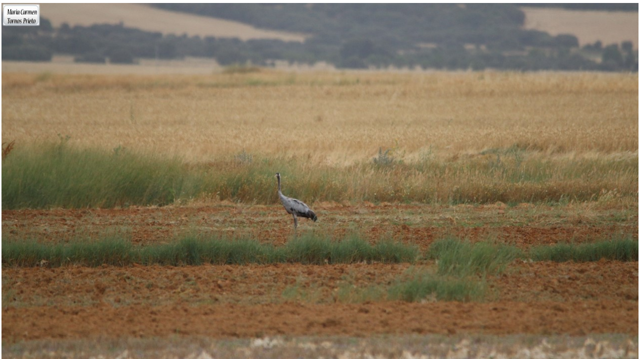
Imagen nº3: grulla en Tornos (TE) durante julio. Mari Carmen Tornos