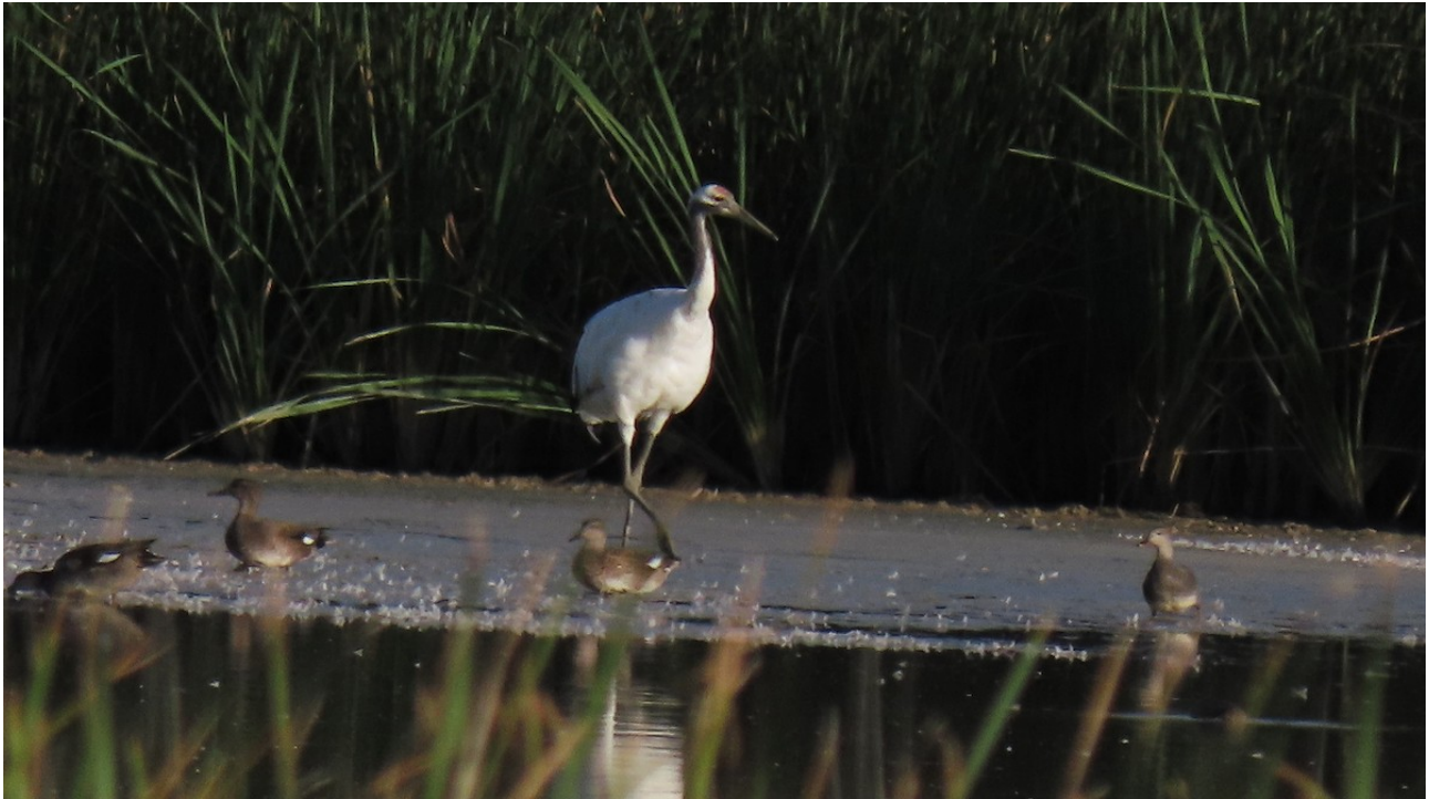
Imagen nº 7: Grulla manchú en laguna de la Nava.