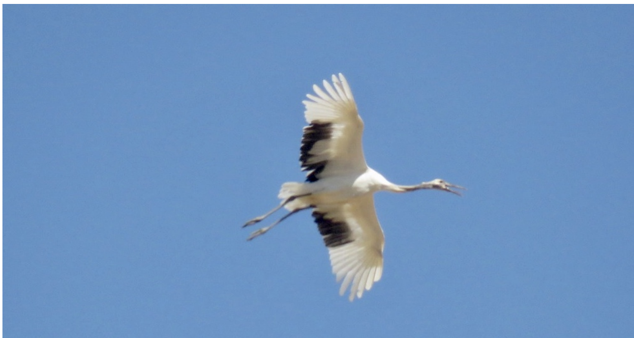
Imagen nº 6: Grulla manchú en vuelo en laguna de la Nava (P)

Con toda probabilidad este ave debe tratarse de un escape de alguna colección particular ya que carece de anillas identificativas.