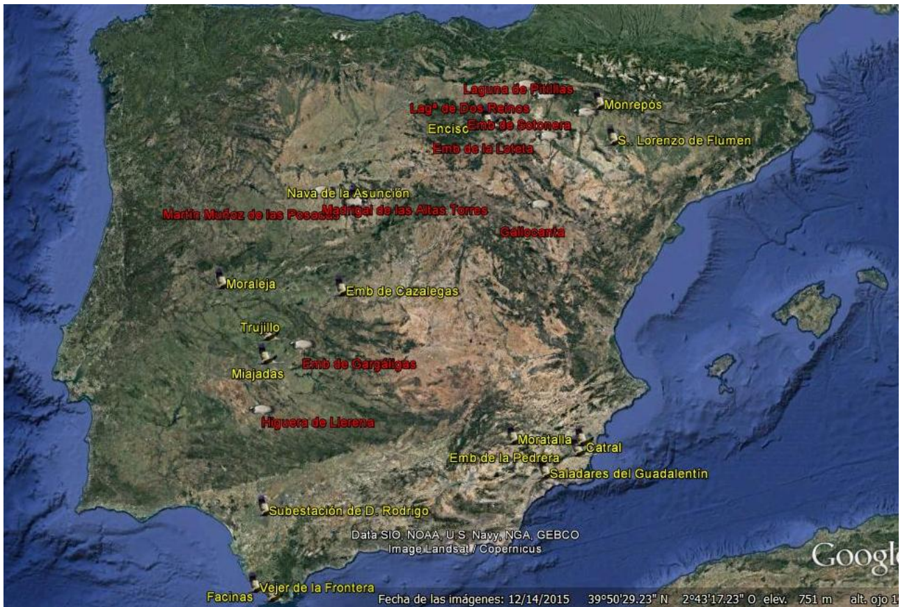
Imagen nº 8: Grullas veraneantes (rojo) y primeros migrantes (amarillo)

27/09/20: 3 por Moraleja (CC) Miguel Todón.