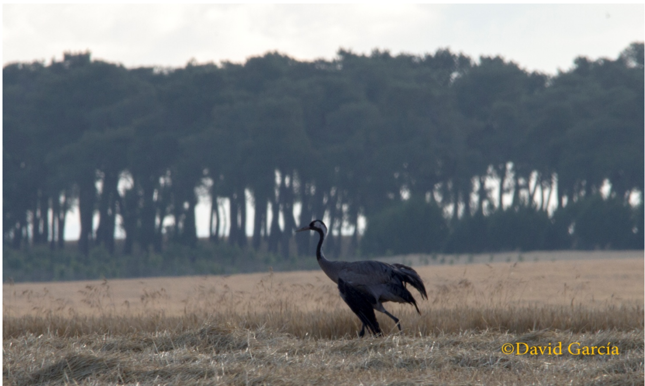
Imagen nº 1: Grulla con ala rota en Madrigal de las Altas Torres (SA) David García.

17/06/20: 2 por Montmesa (HU) Álvaro Sánchez; 1 con ala rota en Madrigal de las Alta Torres (SA) en perfecto estado de salud, David García. Esta misma ave podría ser la misma que fue vista el 15/03 por el mismo observador.