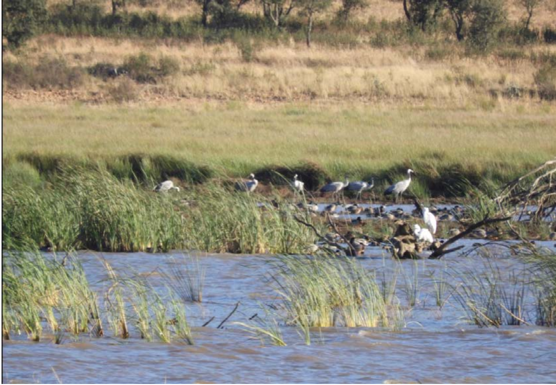
Imagen nº 8: Grullas en emb de Gargáligas (CC) el 12/10/20.