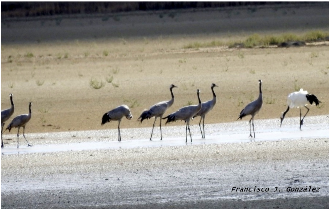
Imagen nº 10: Grullas manchú ( Grus japonensis ) en compañía de grullas comunes en Villafáfila (ZA). Foto: Juan J. González el 14/10/20 (eBird).