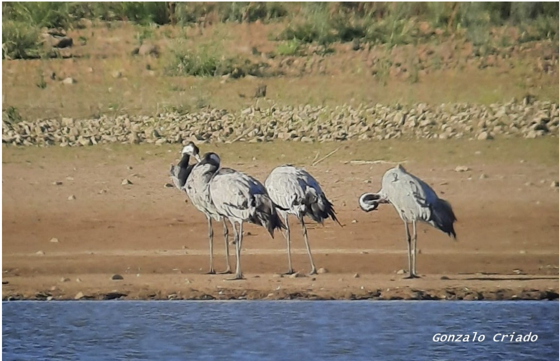
Imagen nº 11: Primeras grullas en emb de los Canchales (BA) el 14/10/20.