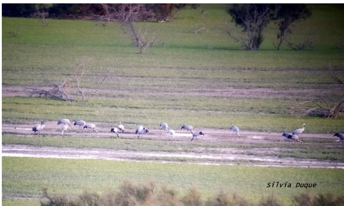
Imagen nº 12: Grullas en la alberca de Alboré (HU)