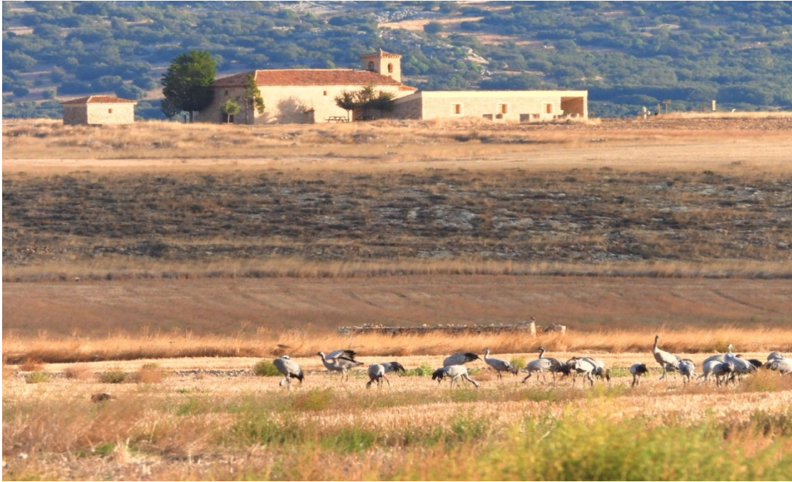
Imagen nº 9: Grullas en Gallocanta el día 13/10/20.